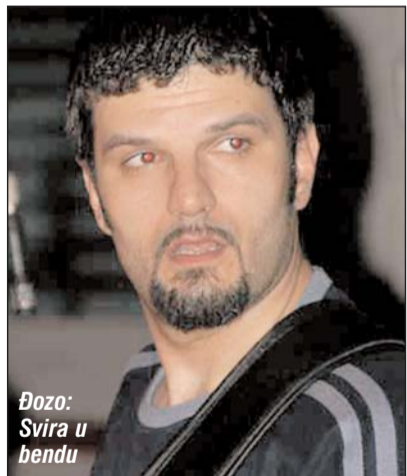
Đozo: Svira u bendu

Trenutno živi u Bihaću, gdje je zaposlen kao profesor u Srednjoj umjetničkoj školi.