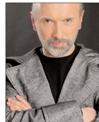
Merlin: Pred očima svojih navijača

ljepši nego što su u mojim pjesmama? Zato sam siguran da te pjesme neće nikoga razočarati, jer one sa sobom nose konkretne poruke.