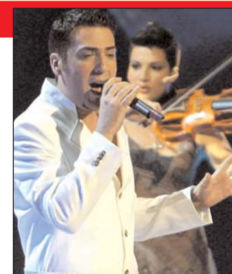
Joksimović: Karijera u usponu

Njegova karijera, međutim, startala je znatno kasnije. Tokom 1999. objavio je debi album, nakon kojeg su uslijedila još tri nasaća zvuka. Prošle godine snimio je kompilaciju s najvećim hitovima u svojoj dosadašnjoj karijeri. Joksimovićeva pjesma „Lane moje“ na Eurosongu u Turskoj osvojila je drugo mjesto, a već nekoliko mjeseci jedan je od udarnih hitova, ne samo u zemljama