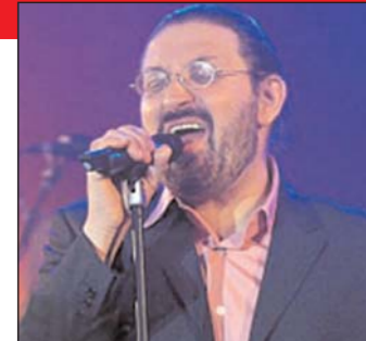
Zanki: Veliki njemački umjetnik

Njemački umjetnik svoju muzičku karijeru započeo je prije nekoliko decenija. Kao pjevač, kompozitor, aranžer i producent, saradivao je s velikim muzičkim zvijezdama poput Tine Turner, Herberta Grenemajera, Ksavijera Naidua, a jedan je od članove kulturne njemačke grupe „Söhnen Mannheims“. Predavač je na prvoj njemačkoj pop akademiji u Manhajmu. Osim na „Bureku“, pjesma